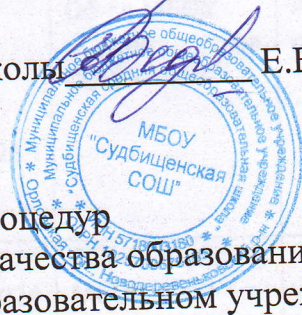
График оценочных процедур и мониторинговых исследований качества образования в Муниципальном бюджетном общеобразовательном учреждении «Судбищенская средняя общеобразовательная школа»